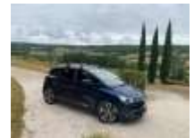
Renault Scénic IV, ontwerp: Laurens van den Acker.