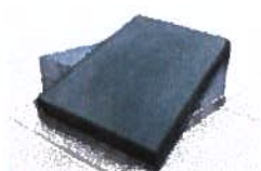
Betonplaten 120x80x12 cm zwart zonder hijsvoorziening