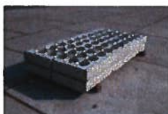
Grasplaat 200x100x12 cm grijs, aslast 13 ton

Wil je graag stapelblokken of legoblokken van beton bestellen? Dan ben je bij Boon Beton aan het juiste adres. Vraag eenvoudig een offerte aan via onze website of neem contact op met ons via (06) 53 70 93 47 of ronald@boonbeton.nl . Wij adviseren je graag over al onze betonnen producten!