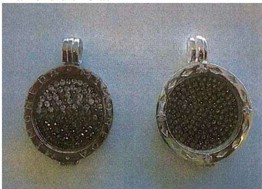
Diamond disk black