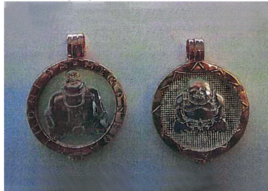
Buddha 1 (dik)