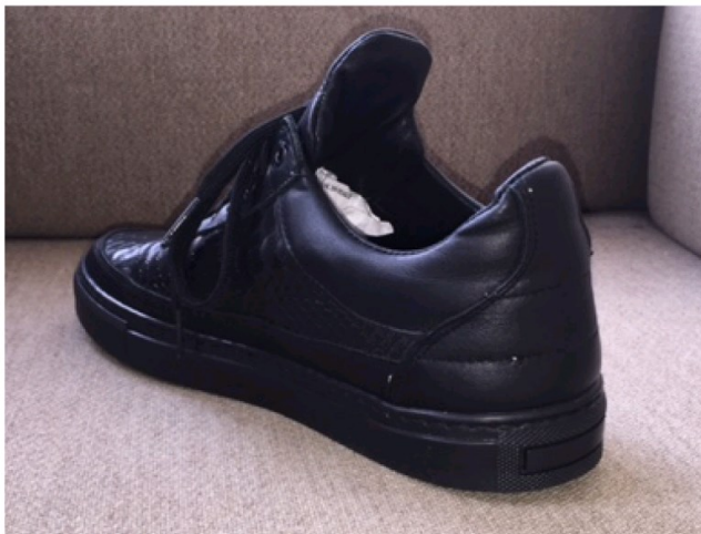
De Schoenenfabriek – Sneaker Snake