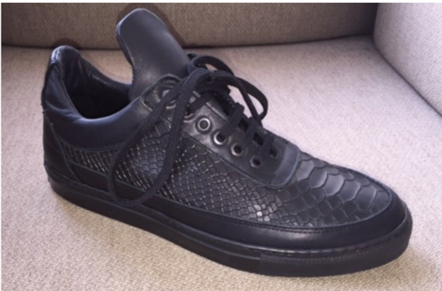
De-Schoenenfabriek - Sneaker Snake

4.19. De 'Sneaker Snake' sneakers verschillen, zoals De Schoenenfabriek terecht heeft aangevoerd, van de 'Low Top Python' sneakers wel in die zin dat het slangenleerpatroon van het bovenwerk anders (gladder) geschud is, dat de in drie vlakken verdeelde hielpartij minder geprononceerd is (omdat die niet – in dezelfde mate – gevuld is) en dat de verlengde schoenlip anders is vormgegeven, in die zin dat die niet over de gehele lengte taps toe loopt in een ronde punt maar ongeveer over de gehele lengte van de verlenging een nagenoeg gelijke breedte behoudt. Deze verschillen zijn naar het voorlopig oordeel van de voorzieningenrechter in het licht van de vele gedetailleerde overeenkomsten evenwel te gering om bij de geïnformeerde gebruiker een andere algemene indruk te wekken dan bij de 'Low Top Python' sneakers. De Schoenenfabriek heeft de van de 'Low Top Python' sneakers afwijkende kleuren van de 'Sneaker Snake' sneakers (naast zwart nog vier andere kleuren) niet aangevoerd als relevant verschil. De voorzieningenrechter neemt daarom met Filling Pieces voorlopig aan dat het enkel wijzigen van de kleur met de 'Sneaker Snake' sneakers het voorgaande niet anders maakt.