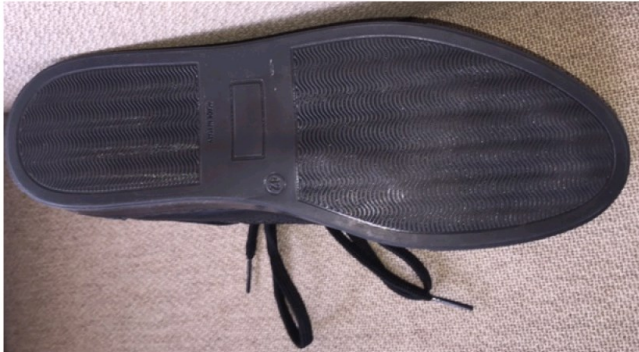
De Schoenenfabriek - Sneaker Snake