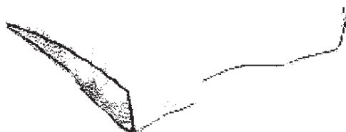
Foto 2 (het als gemeenschapsmodel op naam van Van der Boor geregistreerde kussen)