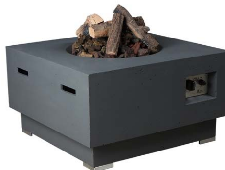
Cosy Living Table 2 (vierkant groot 76x76cm)