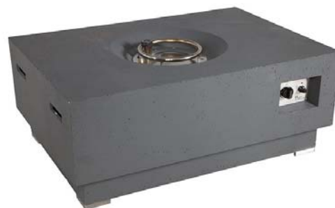
Cosy Living Table 4 (rechthoek 106x76cm)

2.10. Ter zitting heeft Happy Cocooning een Cocoon Table (het daadwerkelijke verhandelde product van Happy Cocooning dat qua algemene indruk het dichtst model 2 als geregistreerd benadert) getoond, alsmede een door haar uit de boedel van de gefailleerde voorganger van Garden Impressions Outdoor (Garden Impressions B.V.) verkregen tafelgashaard getoond (het product hierboven afgebeeld als Cosy Living Table 3). Hierna worden afbeeldingen van voormelde opstelling ter zitting weergegeven, waarbij rechts een Cocoon Table model 2 staat en links een Cosy Living Table 3 3 :