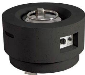
Cosy Living Table 1 (rond)