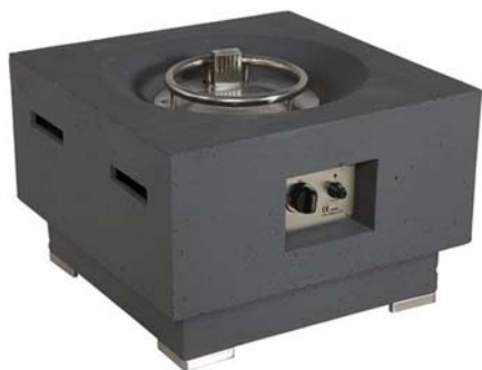
Cosy Living Table 3 (vierkant klein 60x60cm)