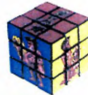
Kama Sutra Cube