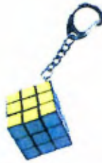
Keychain Magic Cube